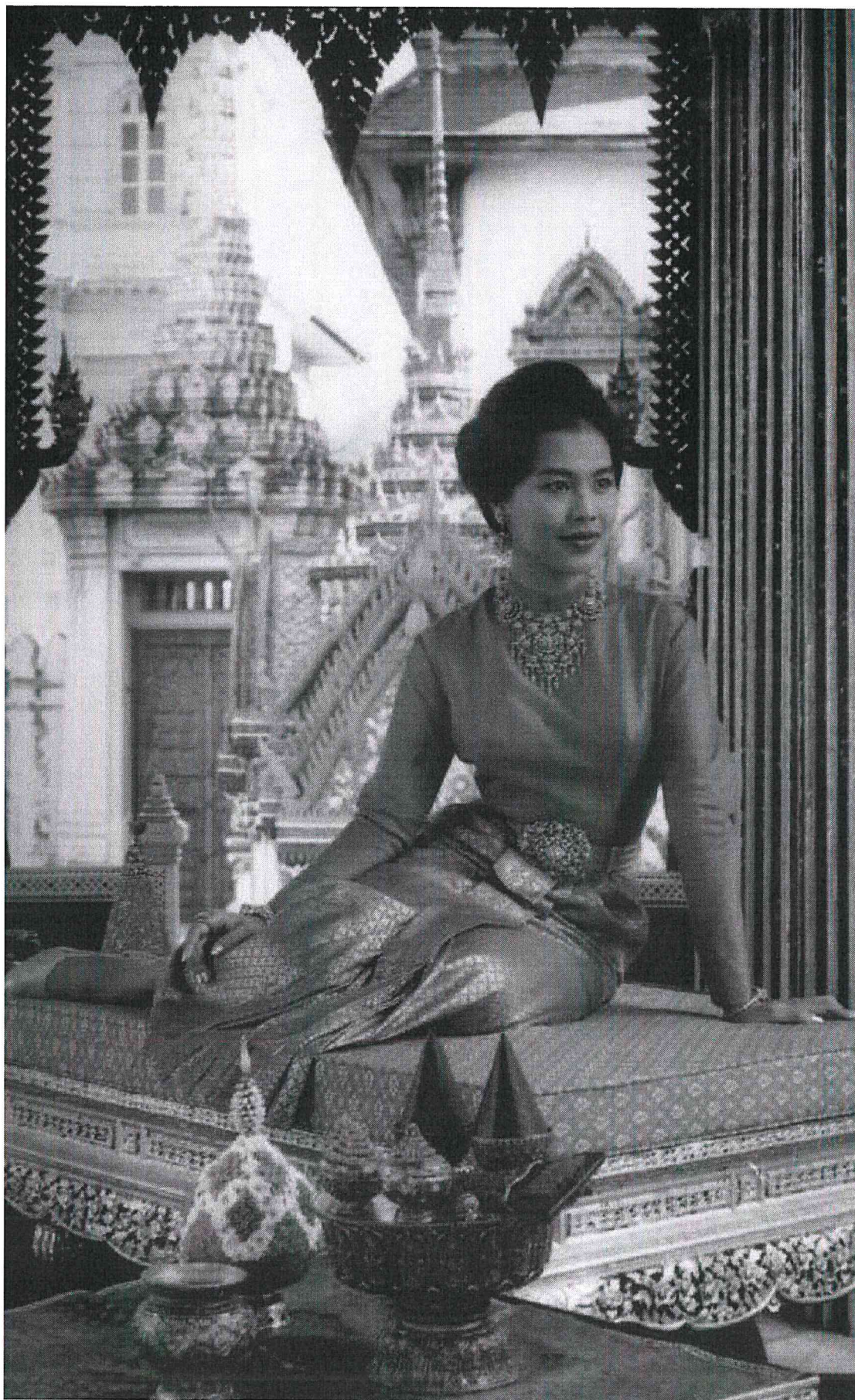
เป็นชุดไทยในงานพิธีตอนค่ำที่ใช้เข็มขัดและเครื่องประดับ ผ้าซิ่นยกทองทั้งตัว จีบหน้านาง เสื้อคอกลมขอบต้งเล็กน้อย แขนยาว และผ้าหลัง สำหรับใช้ในงานพระราชพิธีเต็มยศและประดับเครื่องราชอิสริยาภรณ์