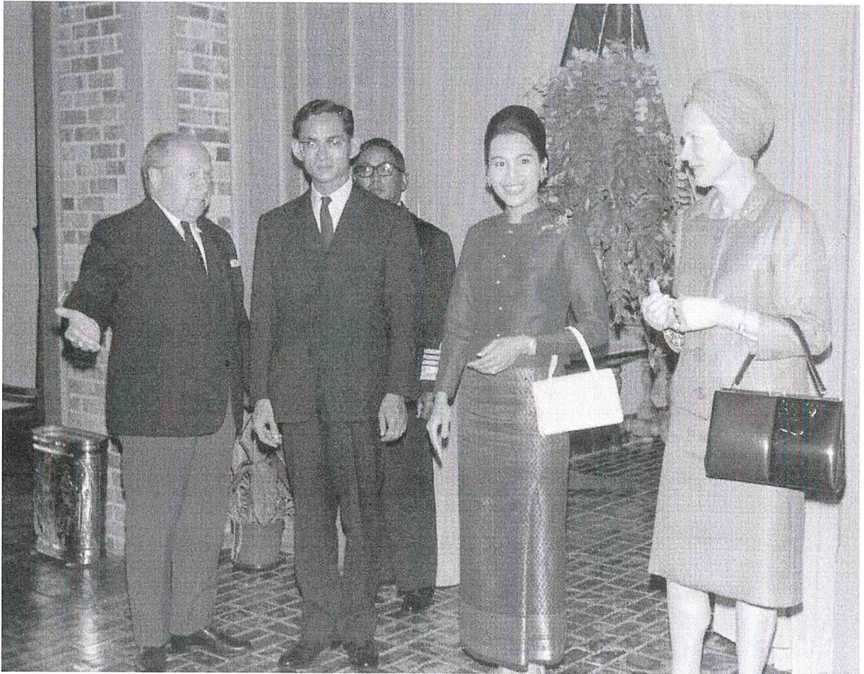
เป็นชุดไทยพิธีตอนกลางวัน ผ้าจีนป้ายเป็นผ้าไหมยกดอกมีเชิงหรือยกดอกทั้งตัว เสื้อแขนยาว ผ่าอก คอกกลม มีขอบตั้ง