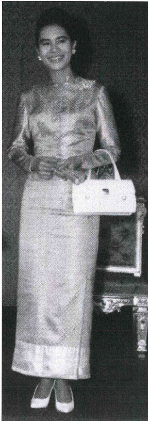
ใช้เป็นชุดพิธีตอนค่ำ ผ้าชั้นยกทองทั้งตัว เลื้อยแขนยาว คอตั้ง เช่นเดียวกับไทยจิตรลดา