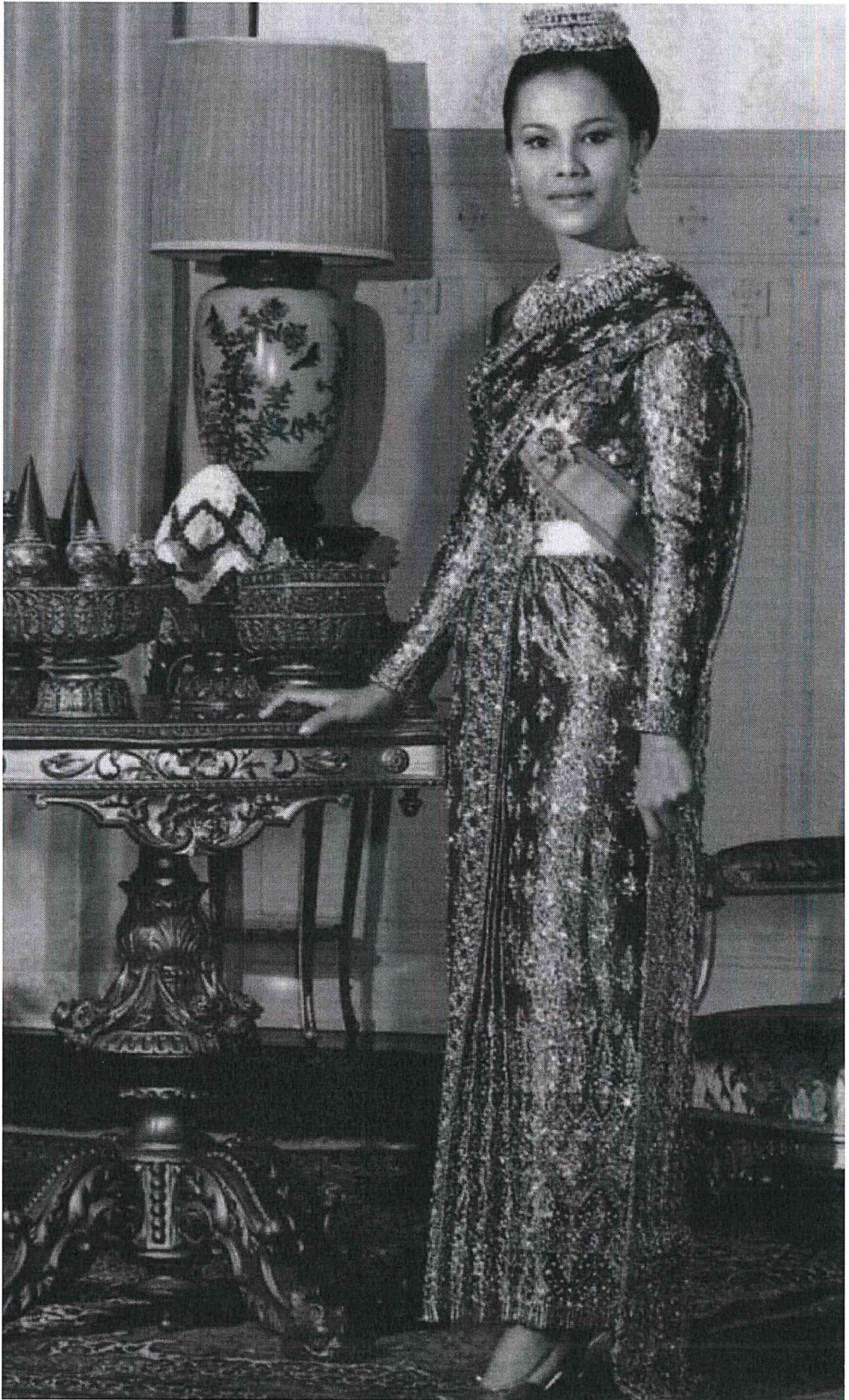
ชุดไทยแบบนี้ใช้ในงานพิธีเต็มยศ ทั้งกลางวันและกลางคืน เป็นแบบเดียวกับชุดไทยบรมพิมาน แต่มีผ้าสไบห่มทับ